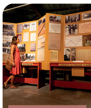
Gênelard Centre d'interprétation de la ligne de démarcation