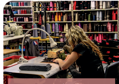
Montceau-les-Mines Manufacture Perrin