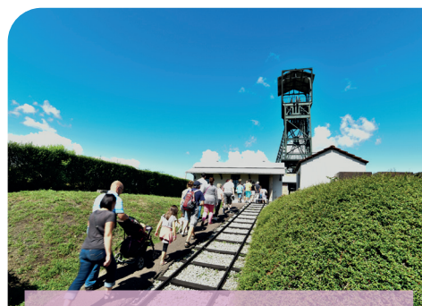
Blanzay Musée de la Mine