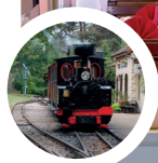
Le Creusot Voiture restaurant du Parc des Combes