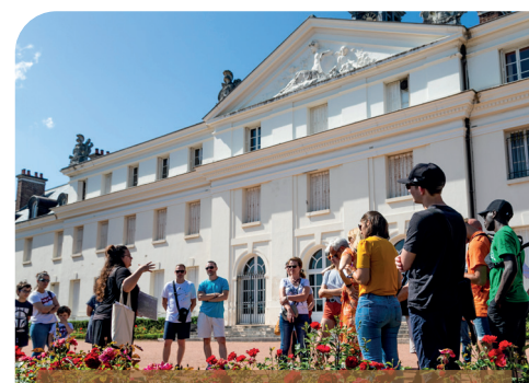
Le Creusot Visite «Coté cour, côté jardin»