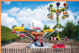
Parc des Combes 180 000 visiteurs