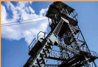
Musée de la Mine 4 023 visiteurs