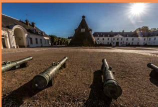
Château de la Verrerie 12 398 visiteurs