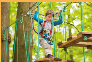
Yaplukapark 2 064 visiteurs