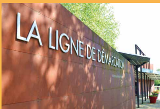
Centre d'interprétation de la ligne de démarcation 1 392 visiteurs